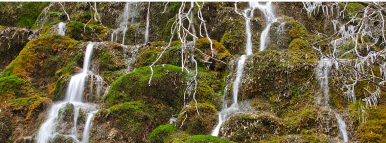
Formaciones de toba, Nacimiento del Río Cuervo

El Nacimiento del río Cuervo conforma un paisaje fluvial espectacular y casi paradisiaco que parece creado para ilustrar cuentos y relatos fantásticos.