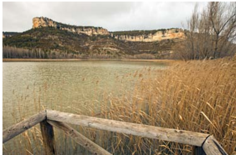
Laguna y cortados de Uña

El embalse de La Toba es un paraje exuberante y exquisito, en el que las aguas del Júcar alimentan este lugar que es apto para el baño.