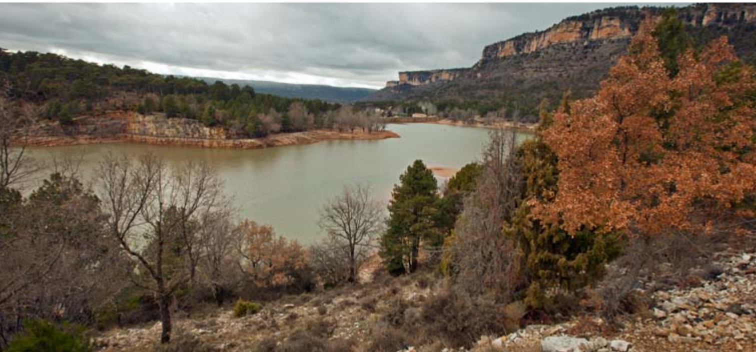
Embalse de La Toba