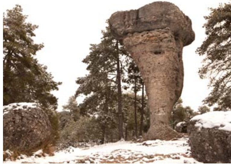
Tormo alto, Ciudad Encantada

La Ciudad Encantada es un lugar muy visitado, singular y pintoresco y que ha sido escenario de grandes producciones audiovisuales a nivel internacional.