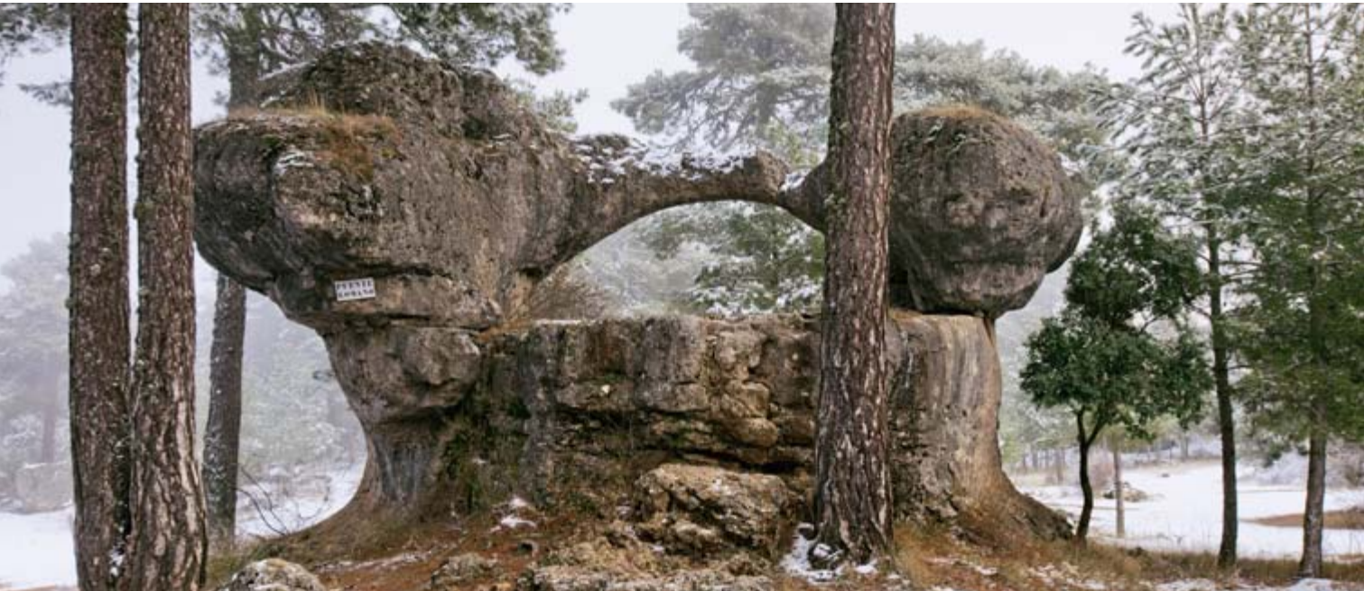
Puente Romano, Ciudad Encantada