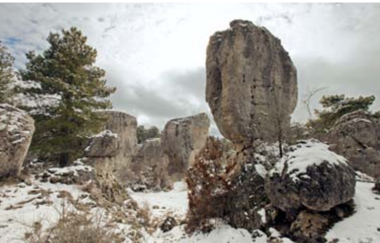
Callejones de Las Majadas

Un curioso espectáculo trazado y esculpido por el azar son Los Callejones de Las Majadas