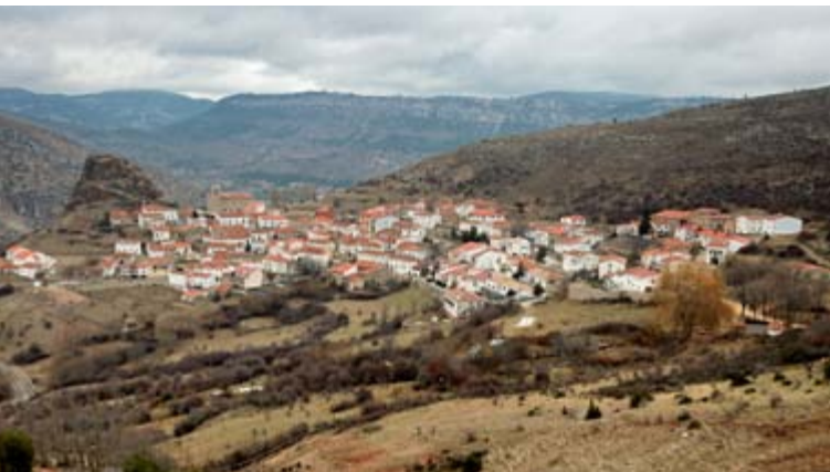
Panorámica de Huélamo

Sin dejar la carretera CM-2105, hilo conductor de nuestro viaje, encontramos Huélamo , un pueblo ubicado junto a la falda de un cerro e inmerso en un entorno natural inigualable y en el que se pueden apreciar restos de lo que fue un castillo que fue sede de la Orden de Santiago. Y enlazando con la CM-2106, yendo en paralelo a la provincia de Teruel y más adelante a la de Guadalajara, hacemos una parada en Tragacete ,