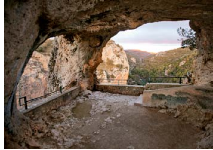
Ventano del Diablo, Villalba de la Sierra

Partiendo desde Cuenca , la ciudad construida entre rocas, hoces y ríos, y tomando la carretera paisajística CM-2105, muy pronto se adentra el viajero en el Parque Natural de la Serranía de Cuenca , más de 73.000 hectáreas de maravillas naturales entre las que discurre íntegramente la ruta que ahora comenzamos. Sin duda una de las joyas medioambientales de Cuenca y Castilla-La Mancha, plena de vegetación, agua, rocas y fauna, destino insoslayable para aquél que quiera disfrutar del turismo de naturaleza. A sólo 20 kilómetros de la capital encontramos Villalba de la Sierra, en cuyo término municipal se halla el Ventano del Diablo , una especie de cueva horadada en la roca desde la que, con cientos de metros de desnivel, se contempla en todo su esplendor el río Júcar abriéndose paso por una angosta garganta. Un enclave ideal para practicar deportes de aventura y disfrutar del paisaje.