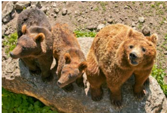
Osos pardos en el Parque de El Hosquillo

Tras disfrutar del prodigio de este parque, la ruta nos deja en Las Majadas , municipio conquense que tiene el privilegio de acoger el paraje conocido como Los Callejones de Las Majadas , la otra Ciudad Encantada. De nuevo el viajero puede deleitarse con formas caprichosas originadas