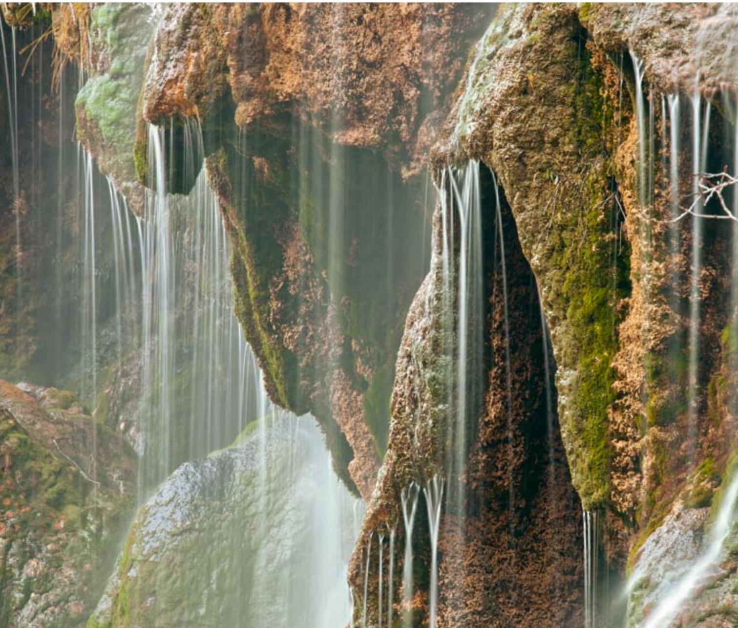
Cascada del Nacimiento del Río Cuervo